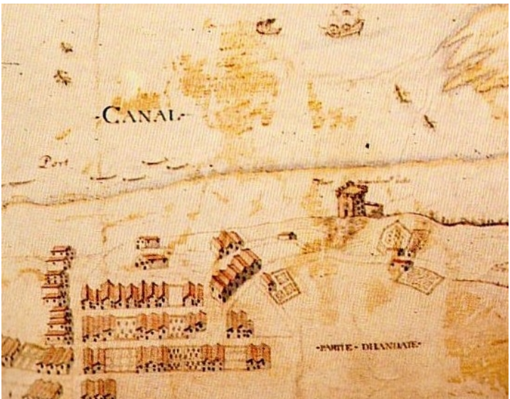
Détail d'une carte des archives de la Marine à Vincennes (1620)