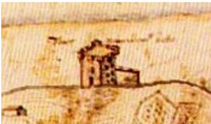
(fort ou tour, détail d'une carte des archives de la marine Vincennes)

Après avoir étudié la proposition de l'ingénieur Aleaume, les conseillers du roi trouvèrent son projet trop ambitieux et lui demandèrent par mesure d'économie de bâtir une simple tour de défense.