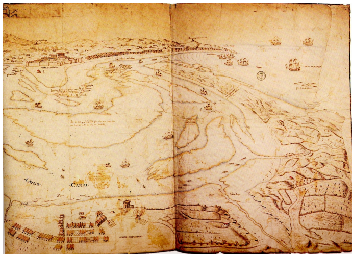
Détail d'une carte des frontières de France et d'Espagne de 1620 (Archives de la Marine Vincennes carte 62)

En 1618, suite aux incidents de plus en plus fréquents entre les pêcheurs d'Hendaye et ceux de Fontarrabie, Louis XIII ordonne la construction d'une Tour pour défendre ses sujets.