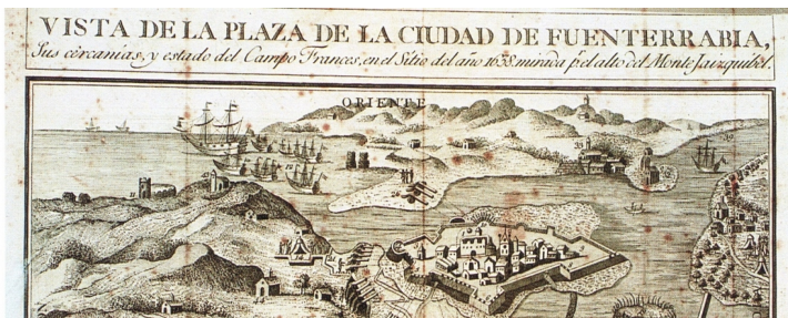
Détail d'une carte sur le siège de Fontarabie (1638) On voit à gauche du bourg d'Hendaye une fortification.